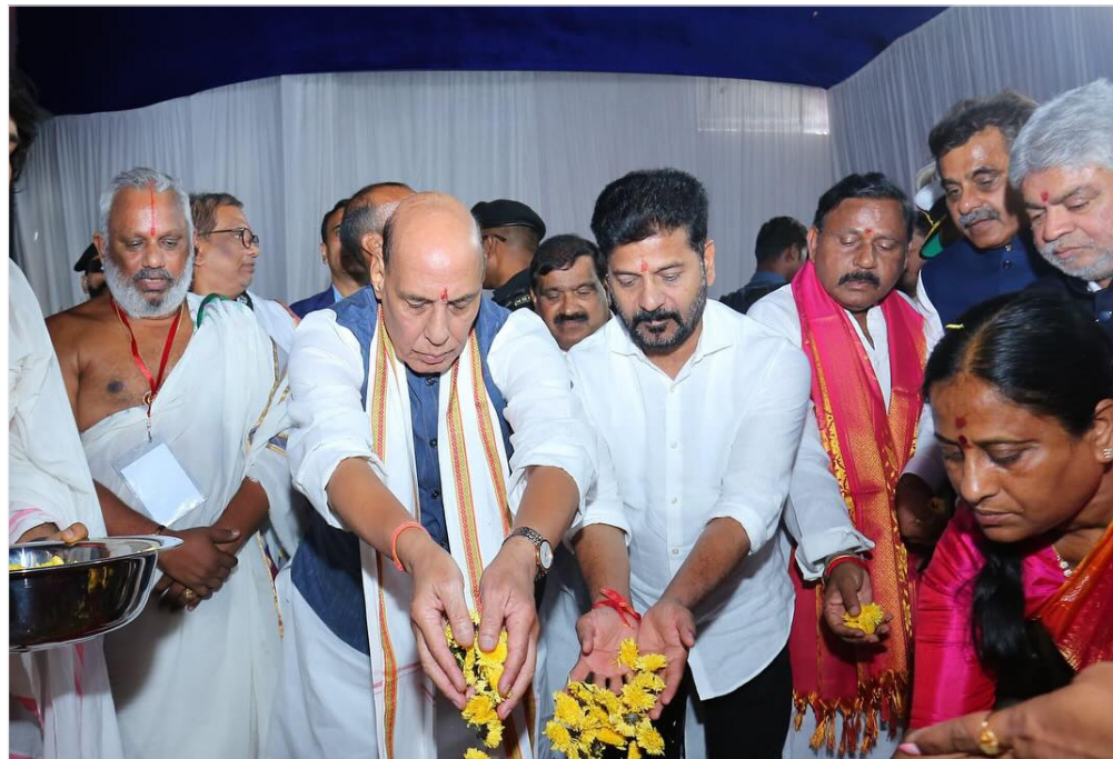
హైదరాబాద్, అక్టోబర్ 15 డీసీ తెలుగు :

పార్టీలు వేరైనా దేశాభివృద్ధిలో అందరూ కలిసి ముందుకెళ్లాలని కేంద్ర రక్షణ మంత్రి రాజీనాథ్ సింగ్ అన్నారు. వికారాబాద్ జిల్లా దామగుండం రిజర్వు ఫారెస్టులో రాడార్ స్టేషన్ నిర్మాణానికి శంకుస్థాపన ఆనంతరం ఏకాగ్రుణ్ణి చేసిన సభలో రక్షణ మంత్రి ప్రసంగించారు. అబ్దుల్ కలాం జయంతి నాడు వీఎల్ఎఫ్ స్టేషన్కు శంకుస్థాపన చేయడం చాలా ఆనందంగా ఉందన్నారు. ప్రాజెక్టుకు ఏర్పాటుకు అన్ని విధాలా అందగా నిలిచిన సీఎం రేవంత్ రెడ్డికి అభినందనలు తెలిపారు. రక్షణరంగ పరికరాల తయారీలో హైదరాబాద్ కు గొప్ప పేరుందని, దేశాభివృద్ధిలో తెలంగాణ పాత్ర కీలకంగా మారినందుకు ముగిసిపోయింది రాజీనాథ్ సింగ్