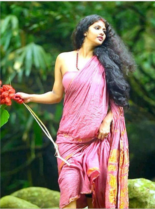
భారీగా షూట్ చేసిన దర్శకుడు రాంగోపాల్ వర్మ