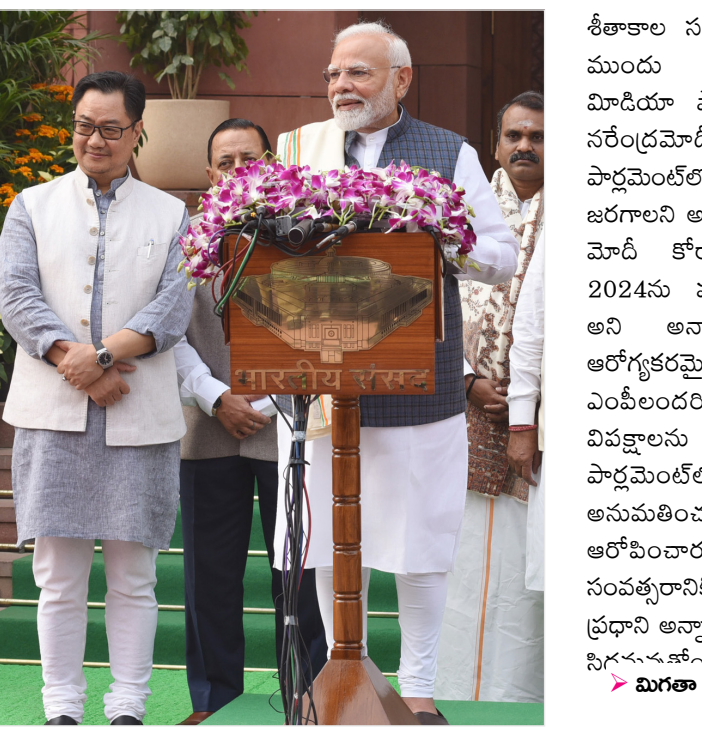
మొగతా 2వ పేజీలో..